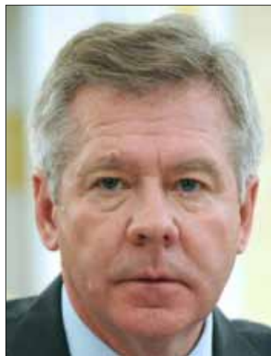
Г. М. Гатилов

4 апреля заместитель Министра иностранных дел России Геннадий Михайлович Гатилов выступил перед активом Совета ветеранов, сотрудниками аппарата, представителями других общественных организаций Министерства на тему: «Внешнеполитические шаги России в международных организациях системы ООН».