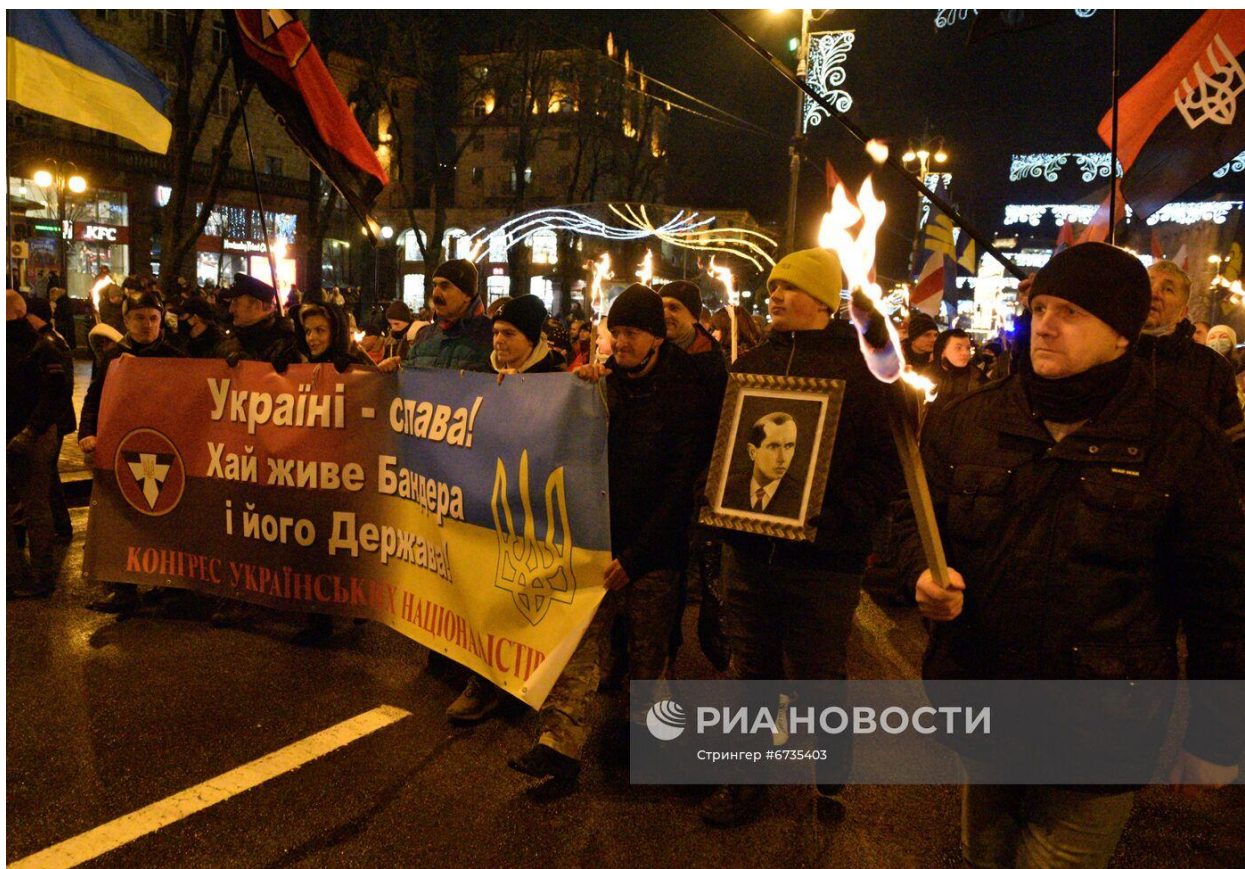
Марш націоналістів в центрі Києва в честь С.Бандери. 1 января 2022 г.

Київ також підприємляє зусилля для прославлення і релігійних діячів, співпрацюючих з гитлерівцями. В частині, на Україні ведеться героїзація уніатського митрополита А.Шептицького, очолюючого Українську греко-католицьку церкву (УГКЦ) в першій половині ХХ в. В його честь відкривають пам'ятники, його іменем називають вулиці в різних містах країни, присвячують наукові конференції і телепередачі. Крім цього, київський режим не залишає спроб переконати Римську католицьку церкву канонізувати А.Шептицького. В частині, об цьому говорив В.Зеленський на зустрічі 9 липня 2025 г. з Папою Римським Львом ХІV в Ватикані. Новина з'явилася в контексті заявлень УГКЦ, що процес беатифікації (канонізації) А.Шептицького знаходиться на заключительній