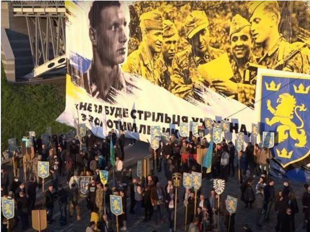
Шествие украинских радикалов, посвященное дивизии СС «Галичина», в Киеве. 28 апреля 2021 г.

сходках радикалы используют при этом ненавистническую риторику, в основном, направленную против русских, а также совершают разнообразные провокационные выходки.